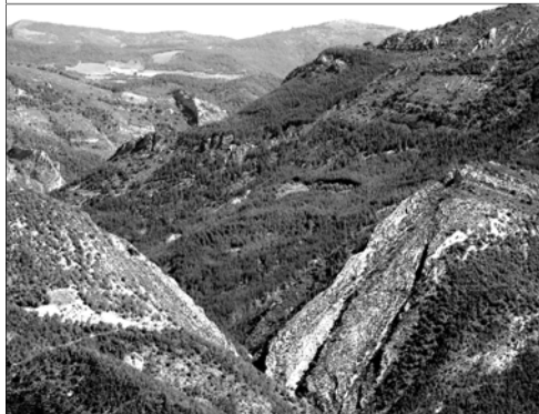
Cluse des Archettes

Vers l'Est c'est la cuvette de Sainte-Marie-Bruis, Montmorin avec un chapelet de collines marno-calcaires recouvertes de bois de pins et les versants de la montagne de Dindaret. Vers le sud-est le col des Tourettes et la montagne de Maraysse.